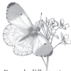
Exemple d'illustration réalisée par Yves Doux

Parution : avril 2016 Ouvrage de 240 pages en couleur. Format : 210 x 280 mm Rédaction et coordination de l'étude : François Radigue Illustrations : Yves Doux Ouvrage collectif de l'Association Faune et Flore de l'Orne (AFFO) Co-édité par les Editions du Tilleul et l'AFFO ISBN 979-10-93914-04-6 (Editions du Tilleul) ISBN 2-9504376-8-0 (Association Faune et Flore de l'Orne)